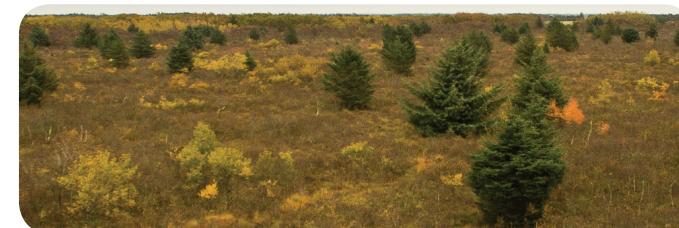
Tilgroning af planter