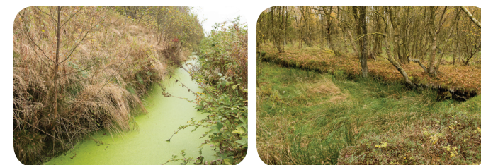
Afvanding via grøfter og tørvegrave