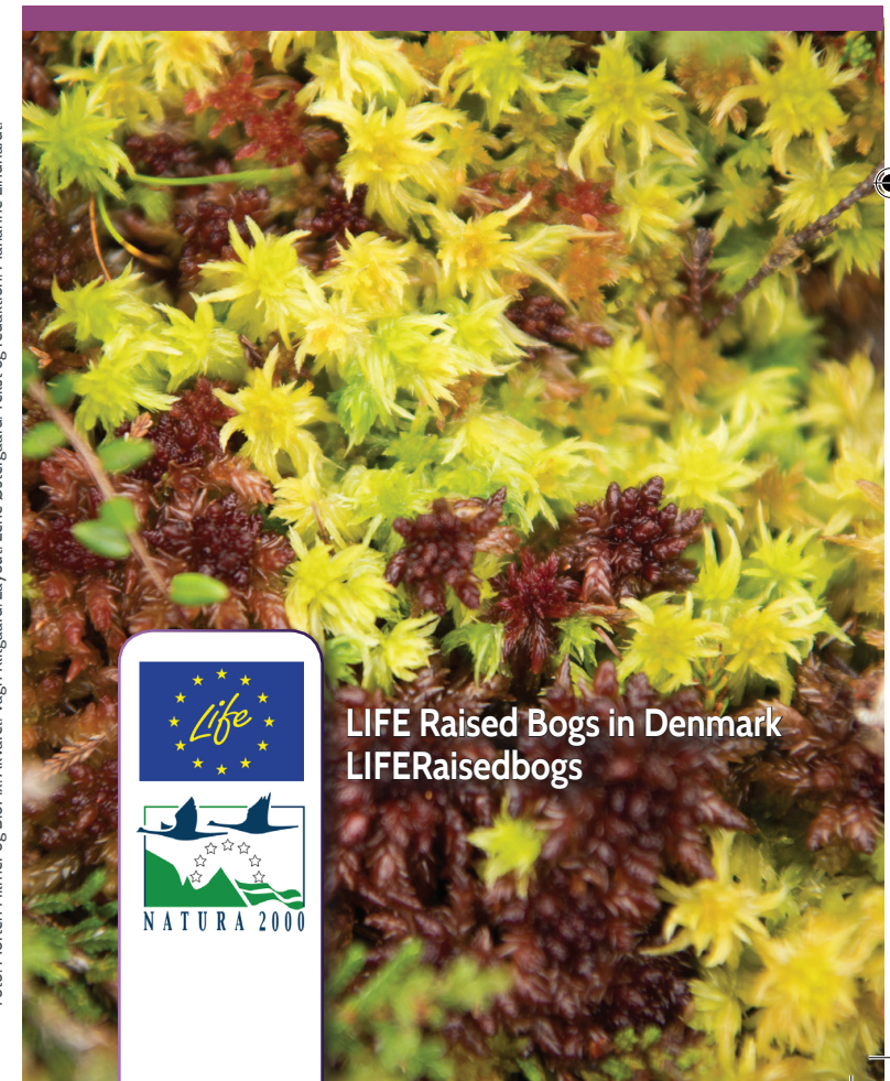
Akvarel: Vagn Klitgaard. Layout: Lene Østergaard. Tekst og redaktion: Marianne Lindhardt.