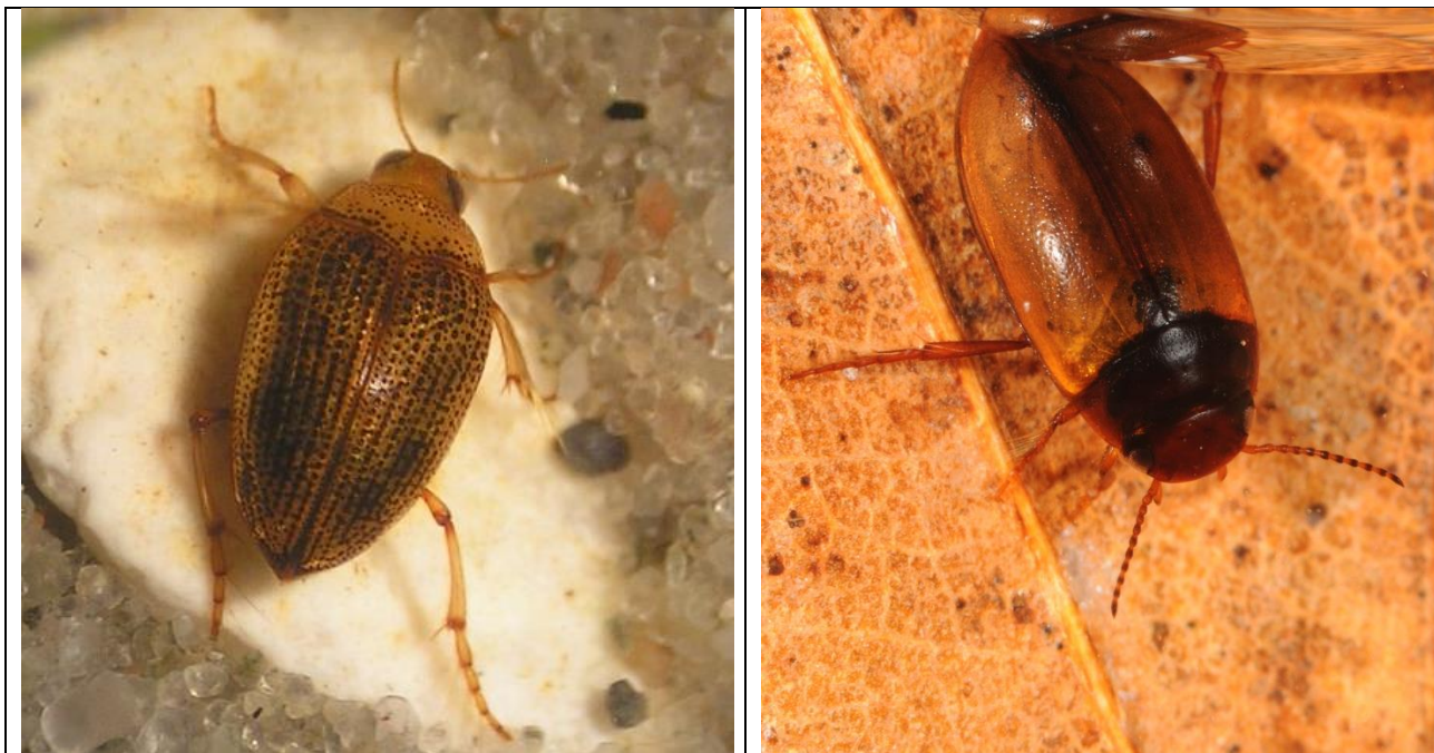
Vandtræderen Haliplus flavicollis (t.v.), der fandtes talrigt i skær 21s, og vandkalven Laccornis oblongus (t.h.), der blev fundet i skær 3.

Da skærets vand faktisk vides at være ret næringsrigt, har omfanget af de omgivende træers beskygning af en del af vandoverfladen muligvis betydning ved på den ene side at tillade tilstrækkeligt lys til vækst af undervandsplanter nogle steder, men samtidigt modvirke en så tæt vækst i vandet af planktonalger m.v., at det ville hindre lys til undervandsplanterne.