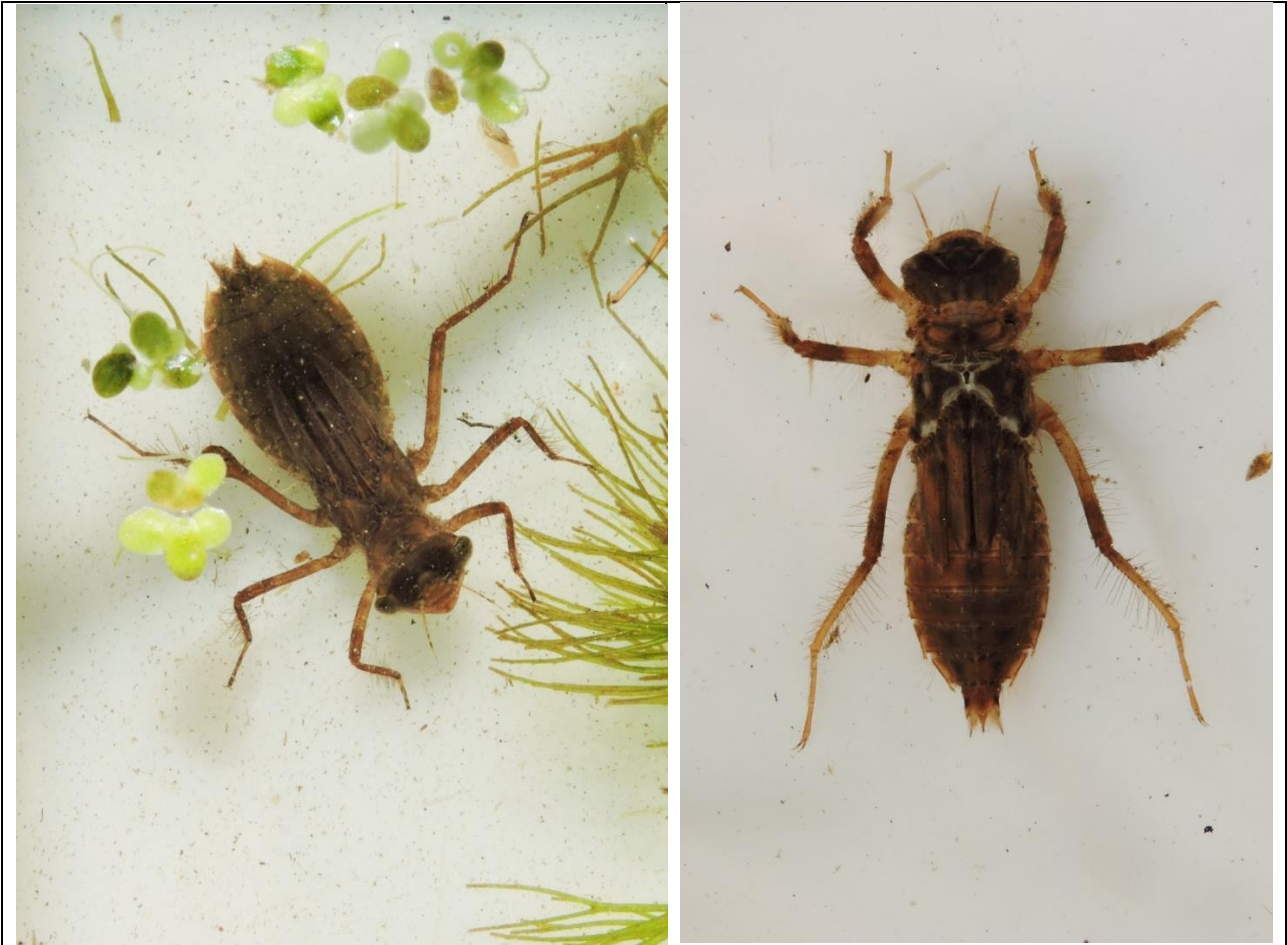
Fuldvoksne nymfer af t.v. stor kærguldsmed ( Leucorrhinia pectoralis ) og t.h. spidspletet libel ( libellula fulva ) fra skær 25.

I de to skær registreredes desuden nogle halvsjældne arter. Det drejer sig om 3 vandbillearter i hvert af skærene 24 og 25, hvoraf 2 arter er fælles. Desuden den ovennævnte beskyttede art stor kærguldsmed ( Leucorrhinia pectoralis ) i skær 25.