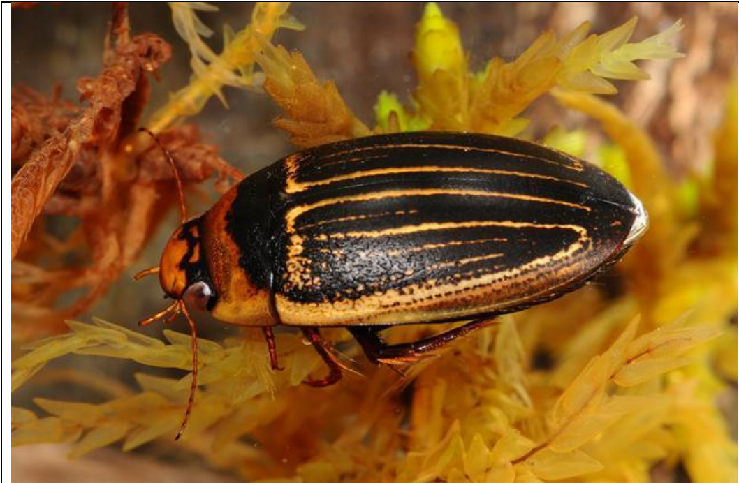
Hun af vandkalven Hydaticus aruspex .